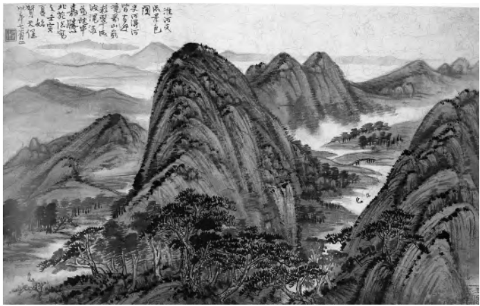
贺天健 淮河流域景色图