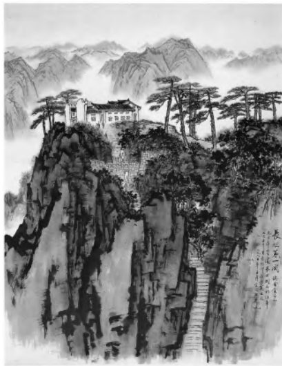
宋文治 长征第一关