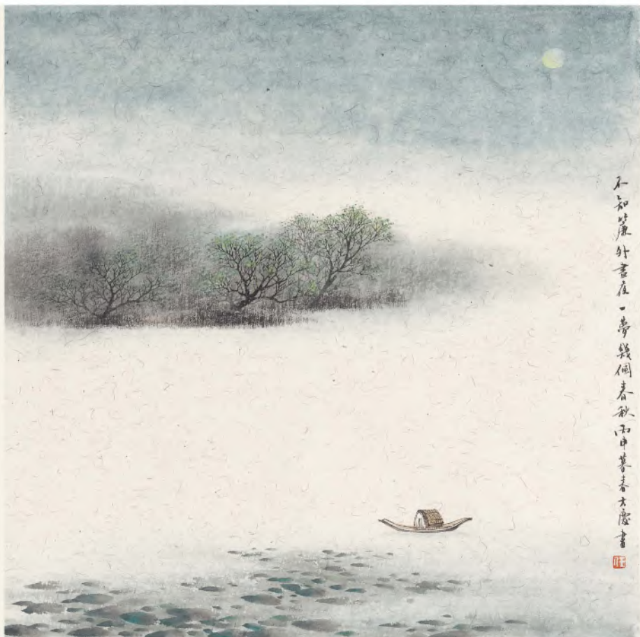
任大庆 不知帘外昼夜一梦几个春秋 33cm x 33cm 2016年