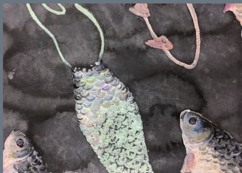
《人生状态》 林丽丽 浙江传媒学院