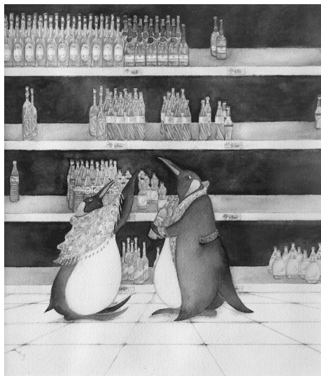
《喝喝哒》 孟子茹 南京艺术学院学生