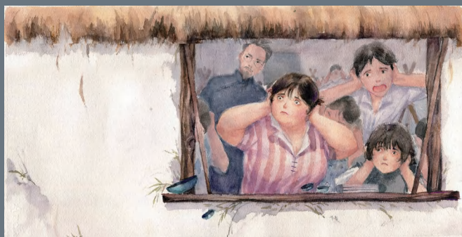
《战争与和平》 庄琳莹 中国美术学院