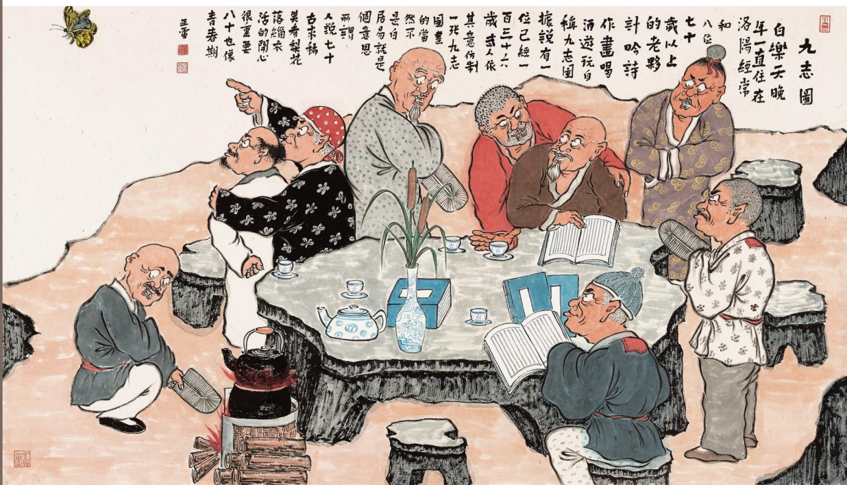
丁亚雷 87cm x 152cm 人物画