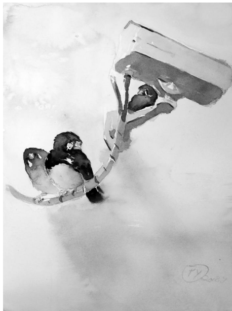
《何枝可依》 冯逾 中国美术学院学生