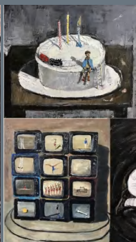
《大树之下》 赵嘉雯 中国美术学院