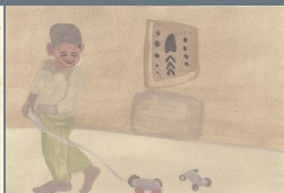
《趣》 纪水清 浙江传媒学院