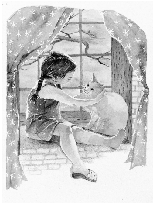
《儿童文学插图》 石沛 南京艺术学院学生