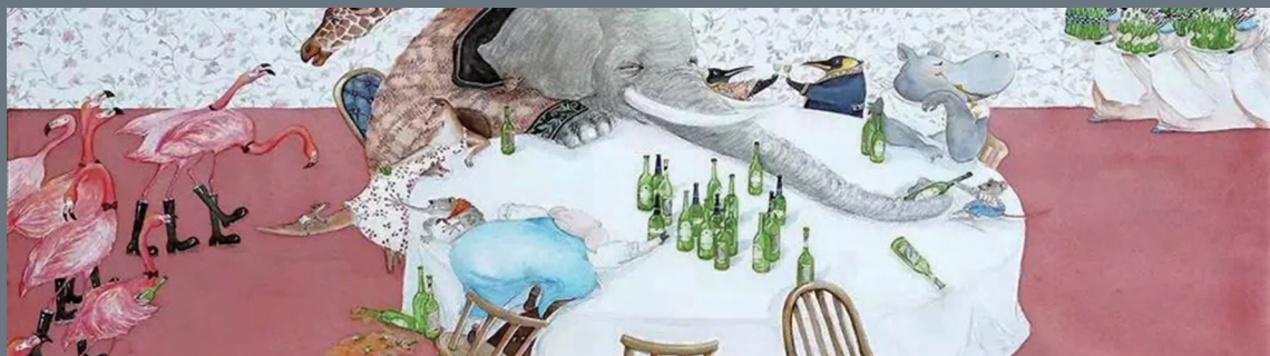
《喝喝哒》 孟子茹 南京艺术学院