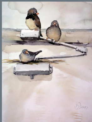
《何枝可依》 冯逾 中国美术学院