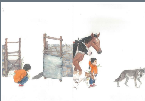
《咚咚咚！谁来了？》 孔羲 南京艺术学院