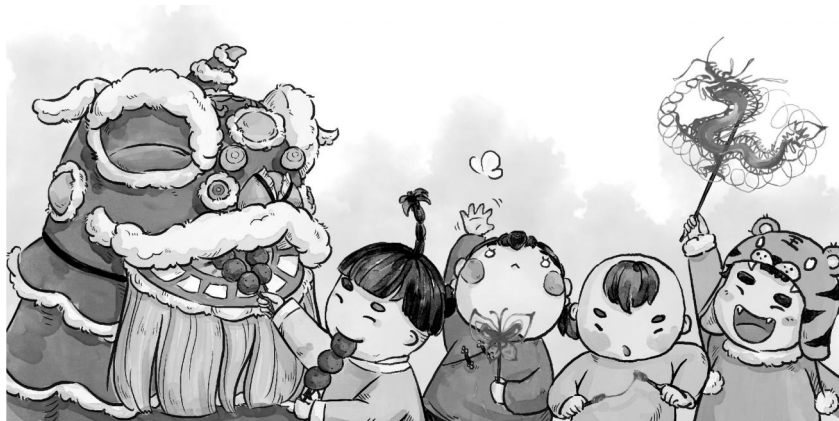
《舞狮》 吕靖靓 浙江传媒学院学生