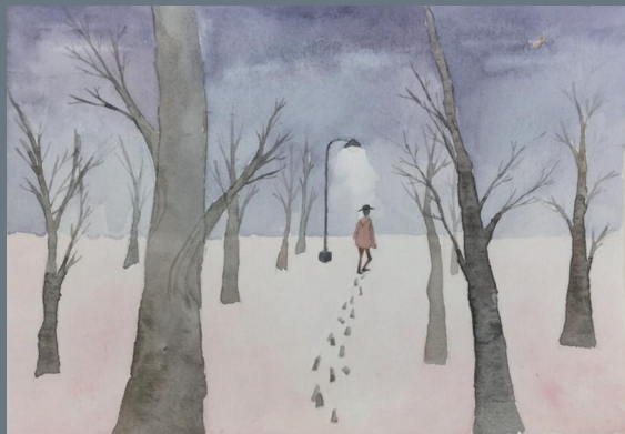
《从等待到处发》 陈可风 浙江传媒学院