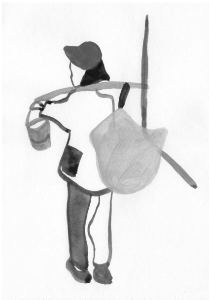
《趣》 纪水清 浙江传媒学院学生