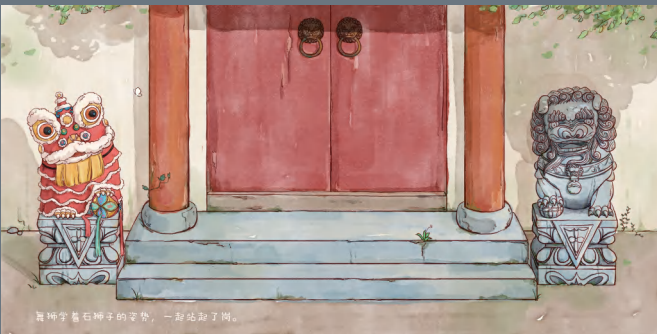
《舞狮》 吕靖靓 浙江传媒学院