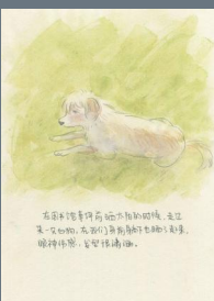
《生活小记》 段凯琳 中国美术学院