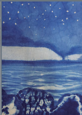
《新月天如水》 尹涵 浙江传媒学院