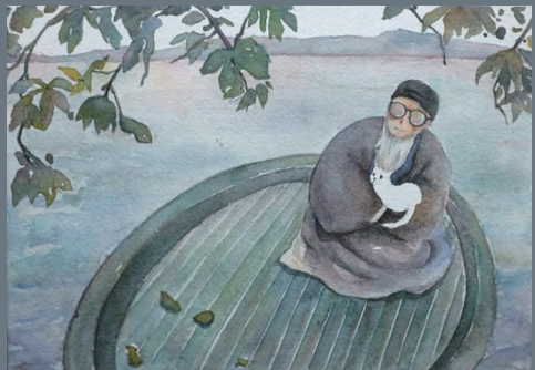
《猫》 贺香兰 中国美术学院