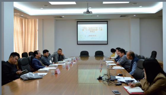
10月15日，图书馆开展“品读丰子恺”征文与绘画比赛评审工作