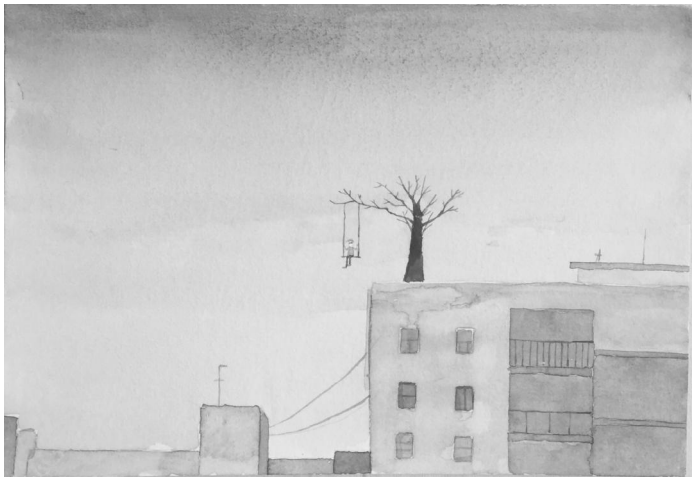
《从等待出发》 陈可风 浙江传媒学院学生