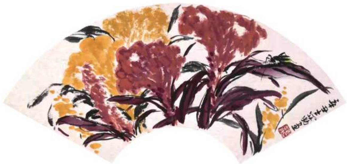
秋艳·黄与红 34x68cm 周志勤 2021年